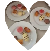
High Tea 11 juni 2024