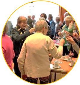
Nieuwjaarsbijeenkomst 11 januari 2024