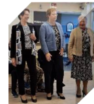
Modedag Vander Klooster Mode 22 oktober 2024