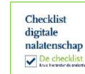
Digitaal nalaten 10 september 2024