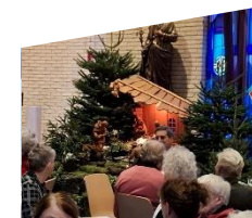
KBO kerstmiddag 19 december 2024