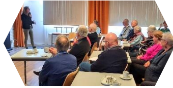
Voorlichtingsmiddag RABO 13 februari 2024

KBO Ontmoetings- middagen Maandelijks ontmoetings- middagen waar koersbal gespeeld wordt, sjoelen, kaarten etc. ook in de zomer elke 3e donderdag, van 14:00-17:00 uur