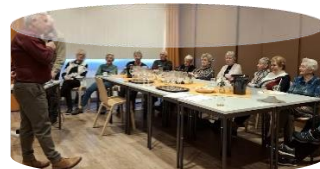
Wijnproefmiddag 10 december 2024