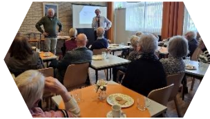
Lezing KNMI 9 april 2024