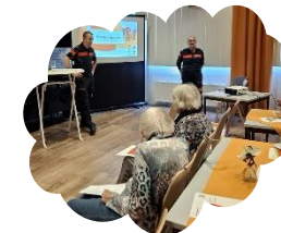
Brandveiligheid bij ouderen 5 november