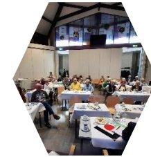
Algemene Ledenvergadering 21 maart 2024