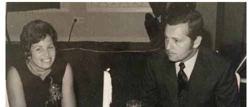
bij gelegenheid van de overdracht van het bureau

In de loop van de jaren 60 mag ik steeds zelfstandiger in het bureau werken. Ik heb me min of meer gespecialiseerd in transport- en beladingssystemen. Ik ontwierp kranen, transportbanden, staalconstructies van hallen en loodsen en die werden dan helemaal op het bureau uitgerekend en getekend, zodat ze van onze tekeningen konden worden gemaakt. In 1971, toen mijn vader 65 jaar werd, hebben mijn jongere broer en ik de zaak van vader overgenomen. Ik was toen 36 jaar. Ik heb gewerkt tot 1994, dus tot mijn 60 ste . Mijn broer is toen verder gegaan met het bureau.'