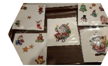
Diamond painten 10 december 2024