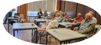
Senioren met computers 14 mei 2024