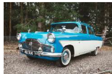
Ford Zephyr MkII

dan langs de manege en de Kortekade en over de Oudedijk de stad in. Ik kreeg op een gegeven moment de auto van mijn vader, onder de voorwaarde dat als één van zijn andere kinderen een auto nodig hadden, ik hem aan hen zou uitlenen. Het was een Ford Zephyr. Dat was zo’n geweldige auto dat mijn schoonvader er ook net zo één had gekocht.’