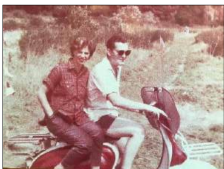
samen op de Lambretta

‘Nee joh, Nieuwerkerk had helemaal geen station in 1960, (Oei denk ik dat is een domme vraag, dat had ik wel moeten weten, ik heb daar wel eens een stukje over geschreven) ik had een Lambretta scooter, je reed de Hoofdweg af tot het Kralingse bos en