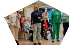
Modedag Vander Klooster Mode 22 februari 2024

KBO Ontmoetings- middagen Maandelijks ontmoetings- middagen waar koersbal gespeeld wordt, sjoelen, kaarten etc. ook in de zomer elke 3e donderdag, van 14:00-17:00 uur