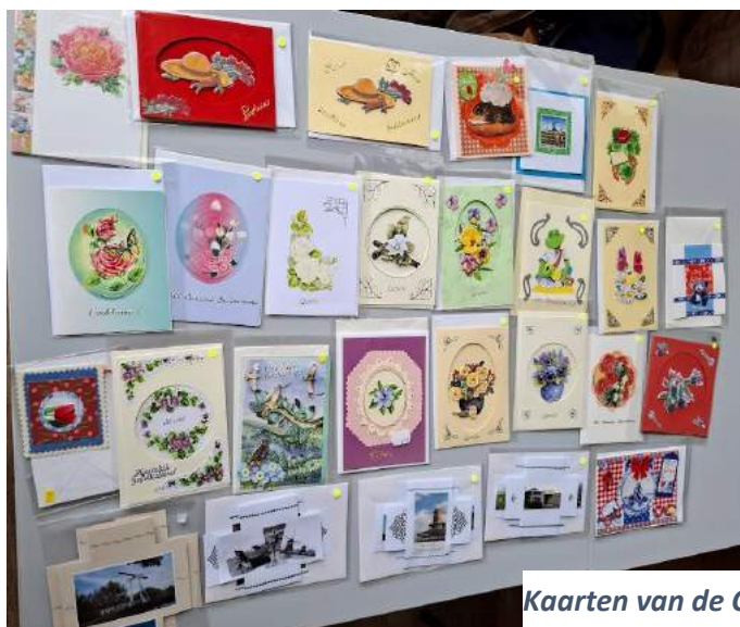
Kaarten van de Creatieve Groep