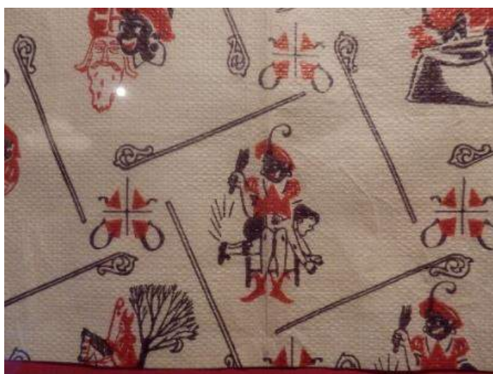
Verpakkingspapier: Zwarte Piet slaat een kindje met de roe op de bips

Het bedrijf maakte in een enorme hal van 50 bij 100m allerlei verpakkingsmaterialen. Zoals ook het Sinterklaas pakpapier hier op een foto. Nu zou je dat niet meer mogen maken!