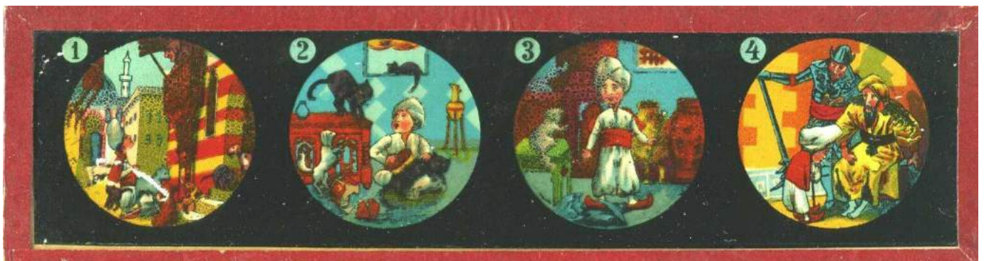
Toverlantaarnplaatsjes van Arretje Nof