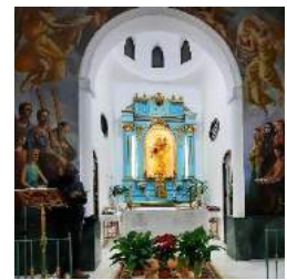
Capilla de la Virgen, Garrucha

Terug in het appartement hoor ik kerkklokken luiden en zoek die kerk op om daar de H. Mis bij te wonen, want dat was zondag niet gelukt.