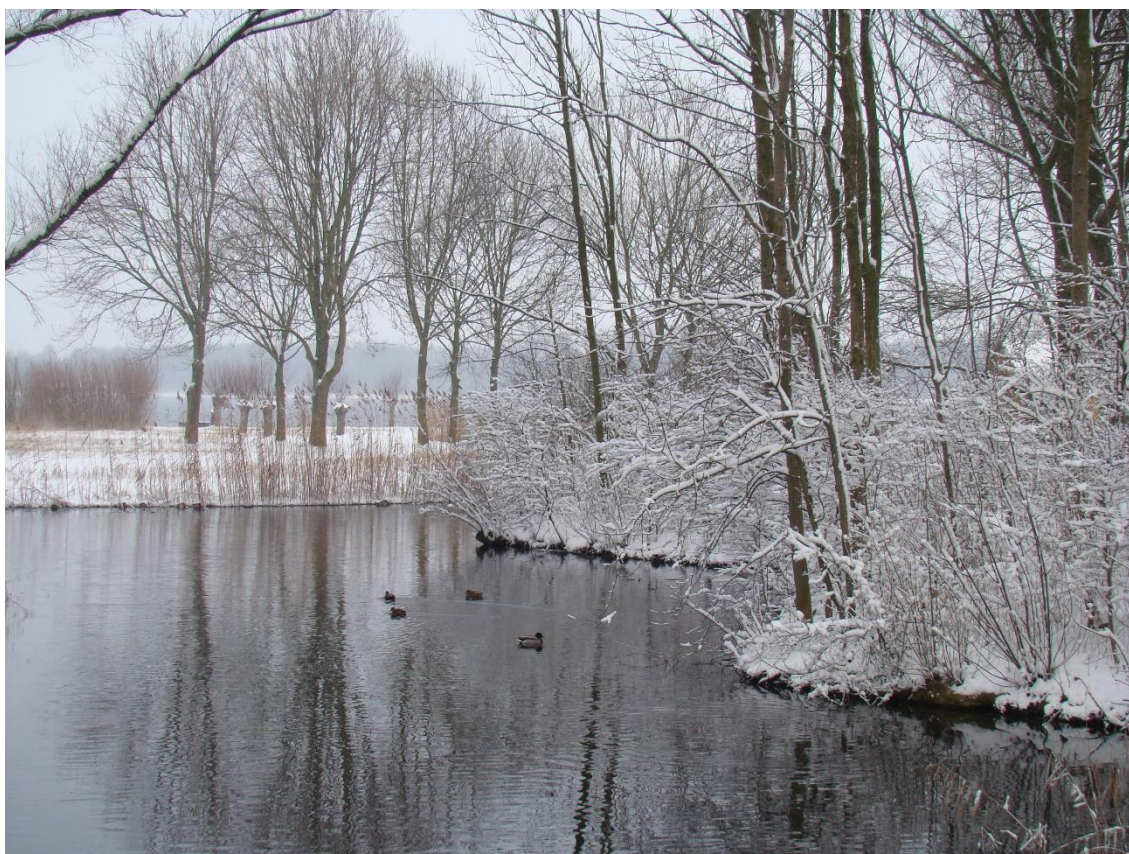
Een winters tafereel bij het Noord Aa