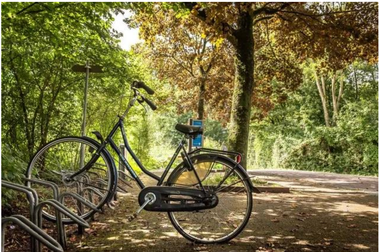
Herfst in het Westerpark in Zoetermeer

(Kijk voor mooie fietsroutes in Zoetermeer op www.zoetermeerisdeplek.nl/inspannen/fietsen )