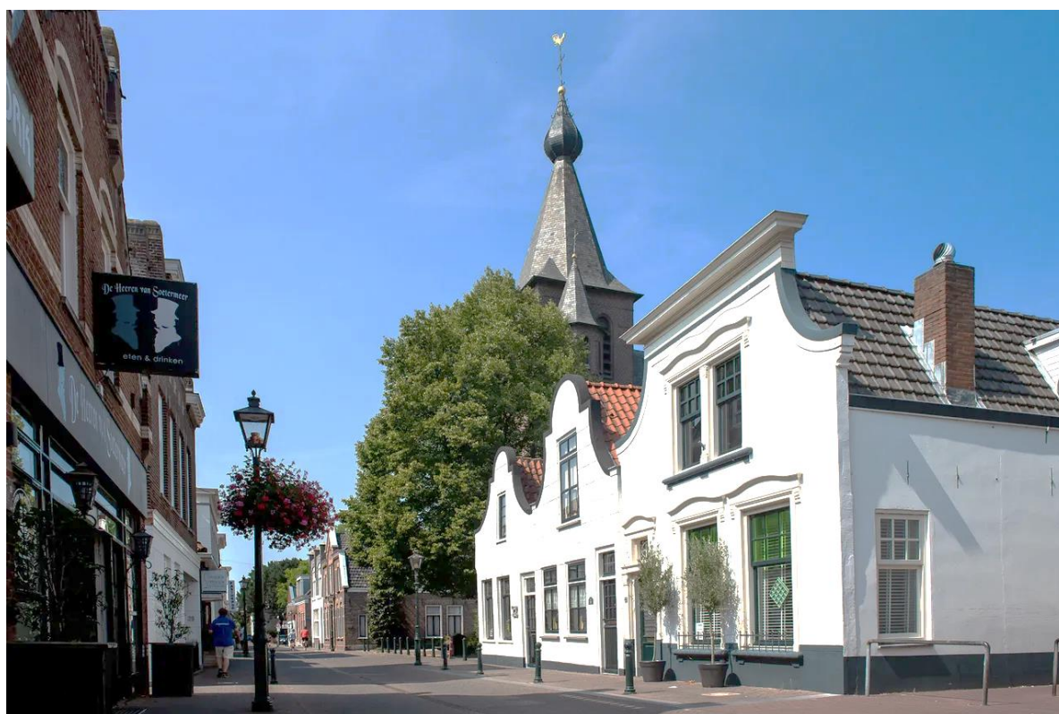
Zomer in de Dorpsstraat van Zoetermeer