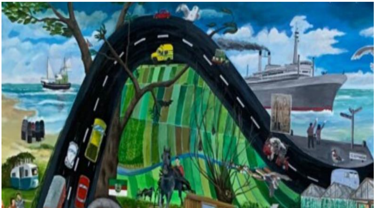
Excursie naar kunstwerk in Leidschendam/Stompwijk (zie pagina 7)