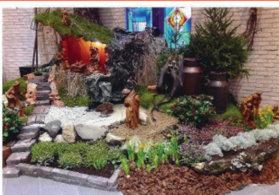
'Kerst het feest van het nieuwe begin, de geboorte van Jezus'

Wees oplettend wanneer u familie hebt in deze huizen en denk goed na en laat u adviseren wanneer u denkt dat dergelijke organisaties u iets voor u kunnen betekenen.