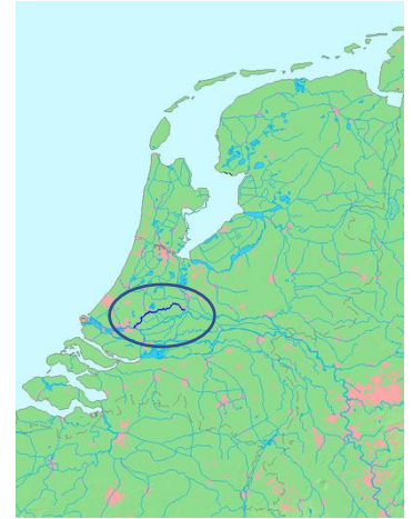
de Hollandse IJssel

Eigenlijk klopt er helemaal niets van. Ons dorp ligt helemaal niet aan de IJssel. De IJssel stroomt namelijk in Gelderland en Overijssel! Het is een vertakking van de Rijn net voor Arnhem en stroomt naar het noorden om bij Kampen via het Ketelmeer in het IJsselmeer te stromen. Ons dorp ligt aan de Hollandse IJssel! Soms wordt in plaats van Hollandse ook wel Hollandsche IJssel geschreven, maar dat is heel deftig. Wij houden het hier op Hollandse . Ik reed jaren geleden elke week over de snelweg van Utrecht naar Den Bosch, de A2 of de E35. Als je naar het zuiden rijdt, staat er ter hoogte van IJsselstein een bord rechts van de weg wat aangeeft dat je de Hollandse IJssel passeert.