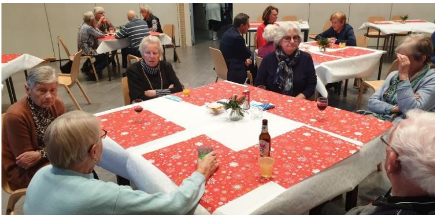
Wat een gezellige aankleding!

We wisten toen nog niet dat we 3 dagen later zouden horen dat er een lock down werd ingevoerd. Weer een kerstmis zonder de dingen die voor ons belangrijk zijn, zoals familiebezoek, naar de nachtmis, uit volle borst zingen. Toch fijn dat de KBO kerstviering is doorgegaan!