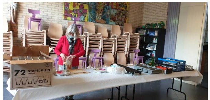
De voorbereiding door één van de assistentes

Het was bijzonder gezellig en goed om elkaar te zien en spreken, daar gaat het om. Niet onvermeld mag blijven dat er weer warme kroketten waren.