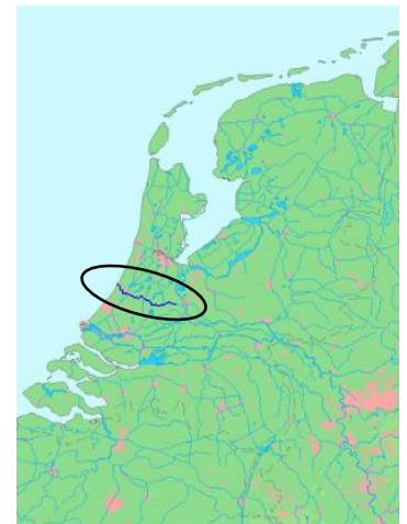
de Oude Rijn

Na deze afsplitsing heet de rivier de Neder-Rijn en stroomt zo door tot Wijk bij Duurstede. Daar takt de Kromme Rijn af. De Kromme Rijn gaat bij Utrecht