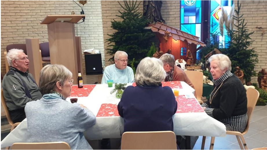
Kerstmaaltijd dicht bij de kerststal

Ondanks de gespannen situatie in december had uw afdelingsbestuur tijdens een ingelaste vergadering op 1 december besloten dat we dit jaar de Kerstviering wel door moest laten gaan. Dat gold niet voor de knutselactiviteit die voor 9 december was gepland. We meenden dat het beter was die te schrappen om zo een bijdrage te leveren aan de beperking van de verspreiding van het corona virus. Maar om dat ook te doen met de Kerstviering - voor de tweede keer op rij nota bene - vonden we echt te ver gaan. De keren dat we dit jaar een High Tea organiseerden, hebben ons geleerd dat het prima mogelijk is met de gedisciplineerde groep die onze leden is, op een ordentelijke wijze bij elkaar te komen. We hielden dan ruim afstand van elkaar en lopen niet allemaal door elkaar en zoenen doen we zo wie zo niet zo vaak met deze generatie.