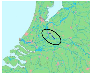
de Kromme Rijn

Zoals iedereen weet komt de Rijn bij Lobith Nederland binnen en krijgt vrij snel op Nederlands grondgebied een aftakking naar het Westen te weten de Waal. Even verder is een aftakking naar het Noorden en dat is de IJssel.