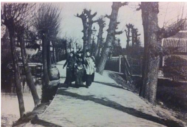
Foto oude 's-Gravenweg

Zo komt het dat de Ringvaart vanaf de start van de 's-Gravenweg bij onze dijk tot ver in Rotterdam evenwijdig loopt aan de 's-Gravenweg.