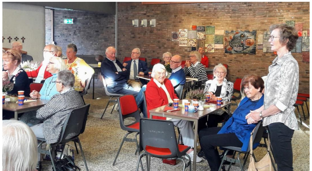
Ontmoetingsdag 3 oktober 2019 Paulus' Bekering